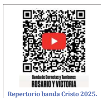
Repertorio banda Cristo 2025.