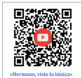
«Hermano, viste la túnica»