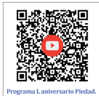
Programa L aniversario Piedad.