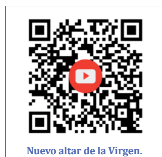
Nuevo altar de la Virgen.