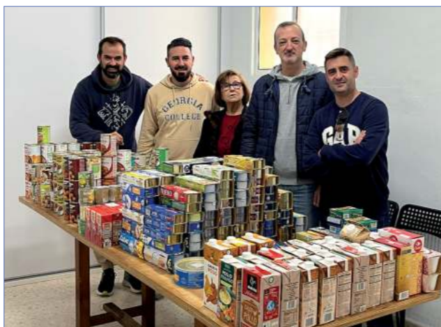
Misericordia entregó 2.500 kilos de víveres a Cáritas en noviembre coincidiendo con el inicio del aniversario de Piedad.