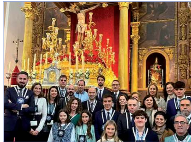
Los cofrades de la Misericordia isleña, en el Encuentro.