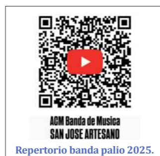
Repertorio banda palio 2025.