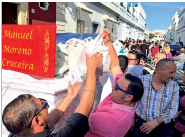
Ensayo solidario «Manuel Moreno Cruceira» en noviembre en el que se recaudaron casi mil kilos de víveres.

Como no puede ser de otra forma, se trata de poner a disposición de los más necesitados los recursos necesarios para ayudar a los más desfavorecidos y paliar la crisis que muchas familias padecen en tiempos complicados.