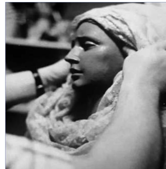
Las manos del escultor, en pleno proceso de realización del boceto en barro de María Santísima de la Piedad.