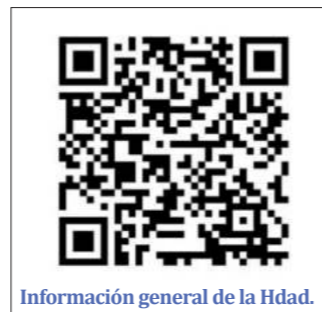
Información general de la Hdad.