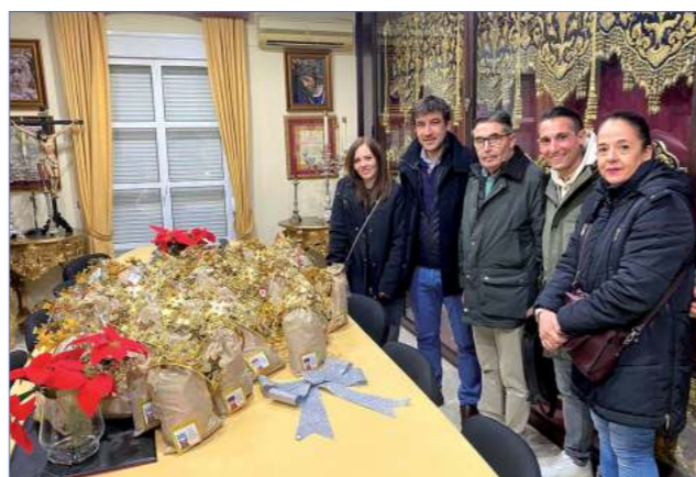
En la fiesta de Reyes Magos se entregaron sacos y coronas rellenas de chocolates para niños de familias de Cáritas.