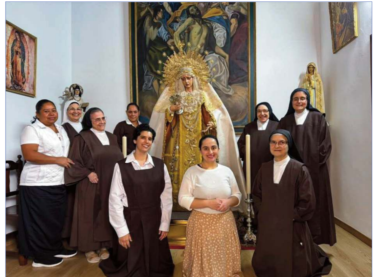
Entrega del diploma de nombramiento de camareras de honor de María Santísima de la Piedad a las Madres Carmelitas Descalzas por parte de nuestro hermano mayor acompañado del vicehermano mayor, en la tarde del viernes 30 de mayo.