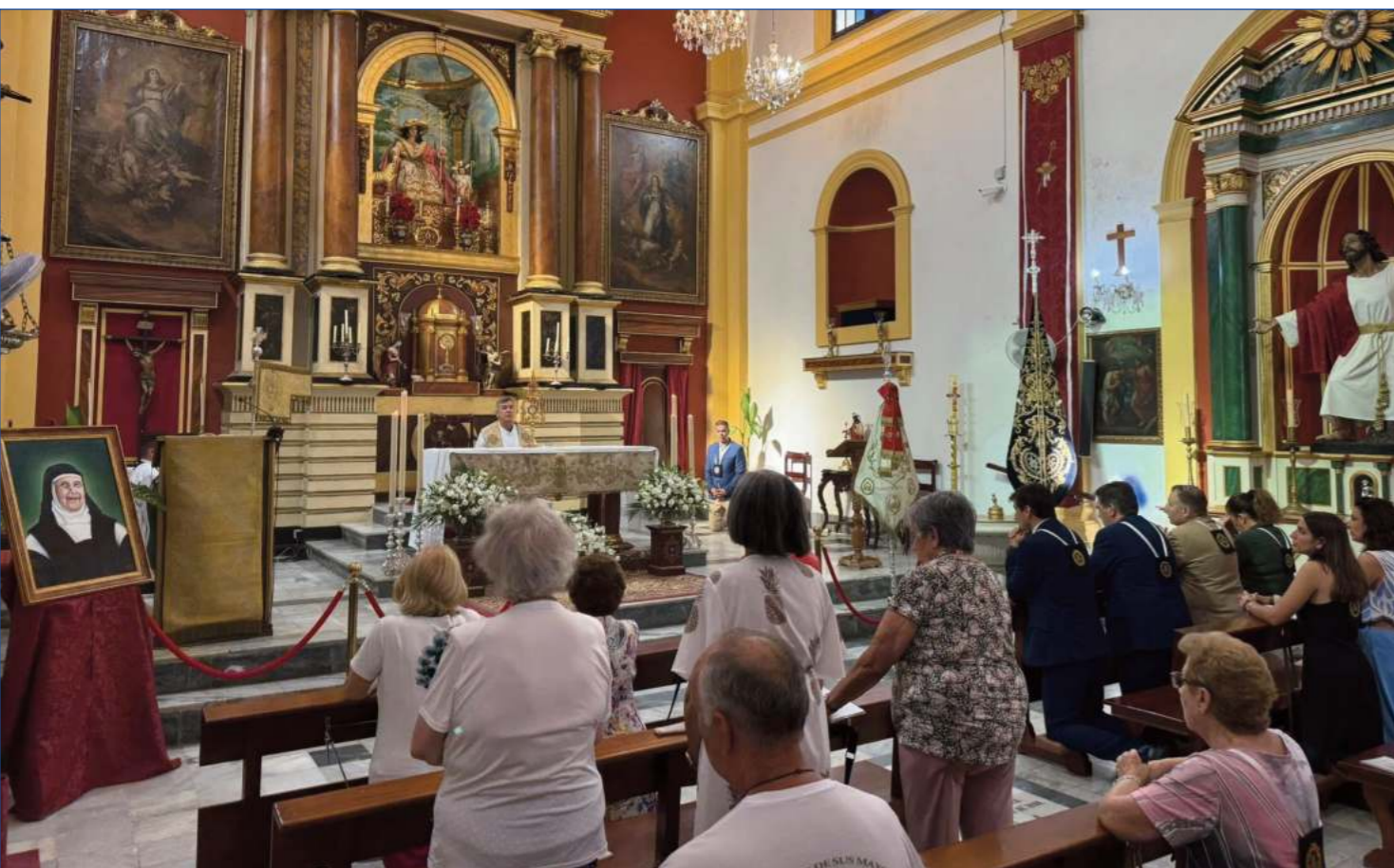
Una imagen de la celebración del Solemne Tríduo Eucarístico, que tuvo lugar entre el 25 y el 28 de junio.