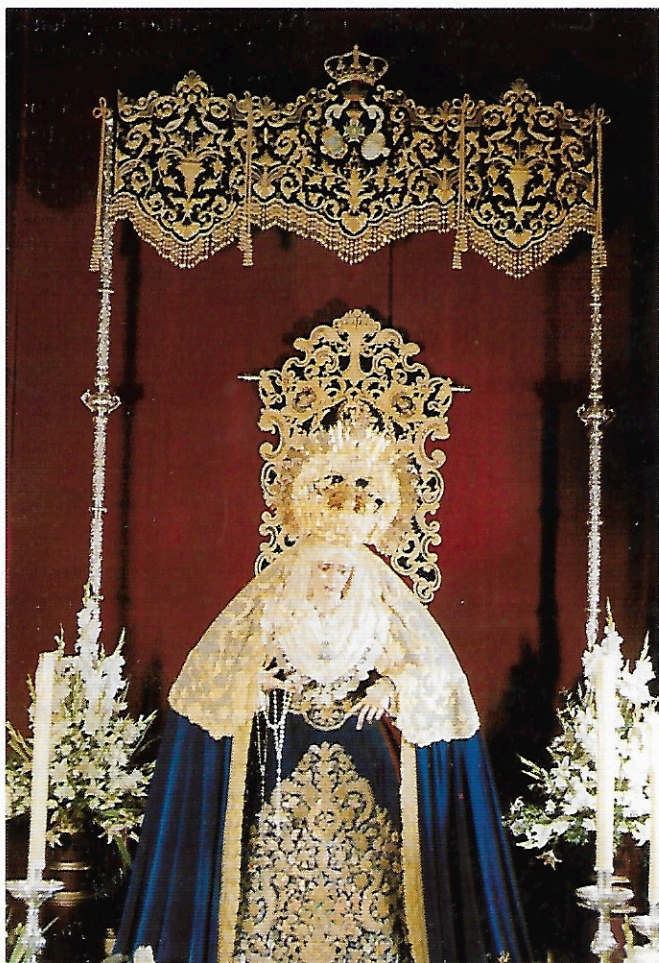
María Santísima de la Piedad, expuesta en Solemne Besamanos, el pasado día 8 de Diciembre de 1990 con motivo del «XV Pregón de la Piedad»