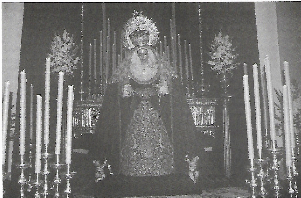
María Santísima en Besamano el 8 de Diciembre de 1987