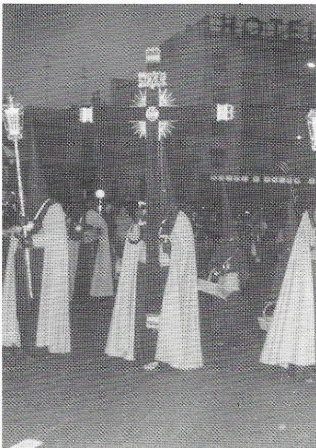
Iniciamos con la Cruz de Guía de nuestra Hermandad, el recorrido por esta Santa Cuaresma de 1987.