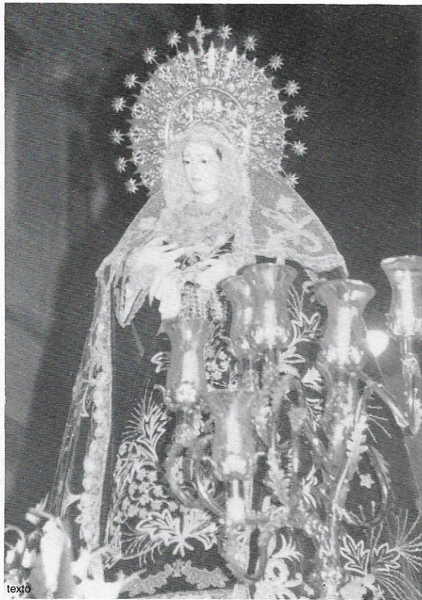
MARIA SANTISIMA DE LA SOLEDAD, EN SU ESTACION DE PENITENCIA, EL PASADO VIERNES SANTO, FECHA INOLVIDABLE PARA NUESTRA HERMANDAD.