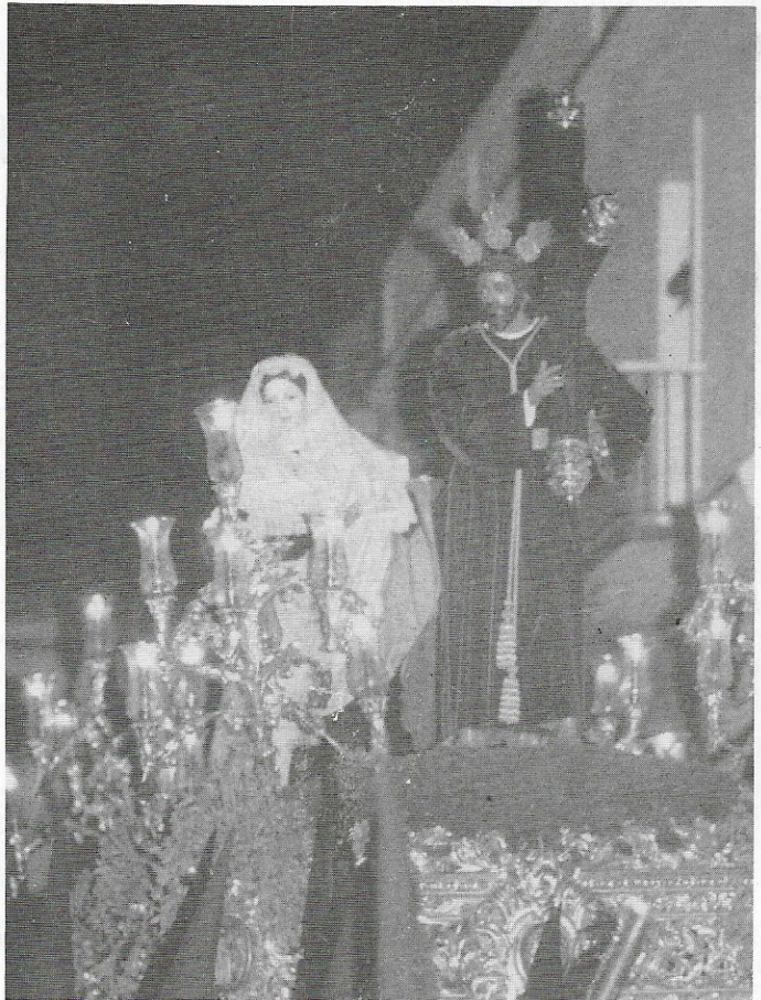
Ntro. Padre Jesús de la Misericordia, en su Estación de Penitencia en 1984.