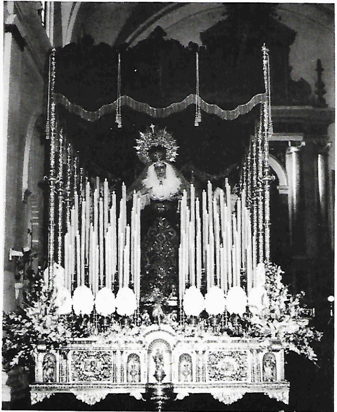
María Santísima de la Piedad, en su paso de palio, momentos antes de iniciar la Estación de Penitencia.