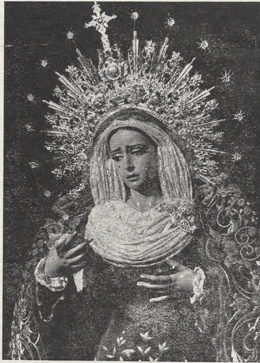
Imagen de María Stma. de la Piedad que fué bendecida solemnemente, el pasado día 8 de Diciembre, Festividad de la Inmaculada Concepción de María

Venerable Hermandad Sacramental, Fervorosa y Devota Cofradia de Penitencia de Nuestro Padre Jesús de la Misericordia, María Santísima de la Piedad y Santa Mujer Verónica