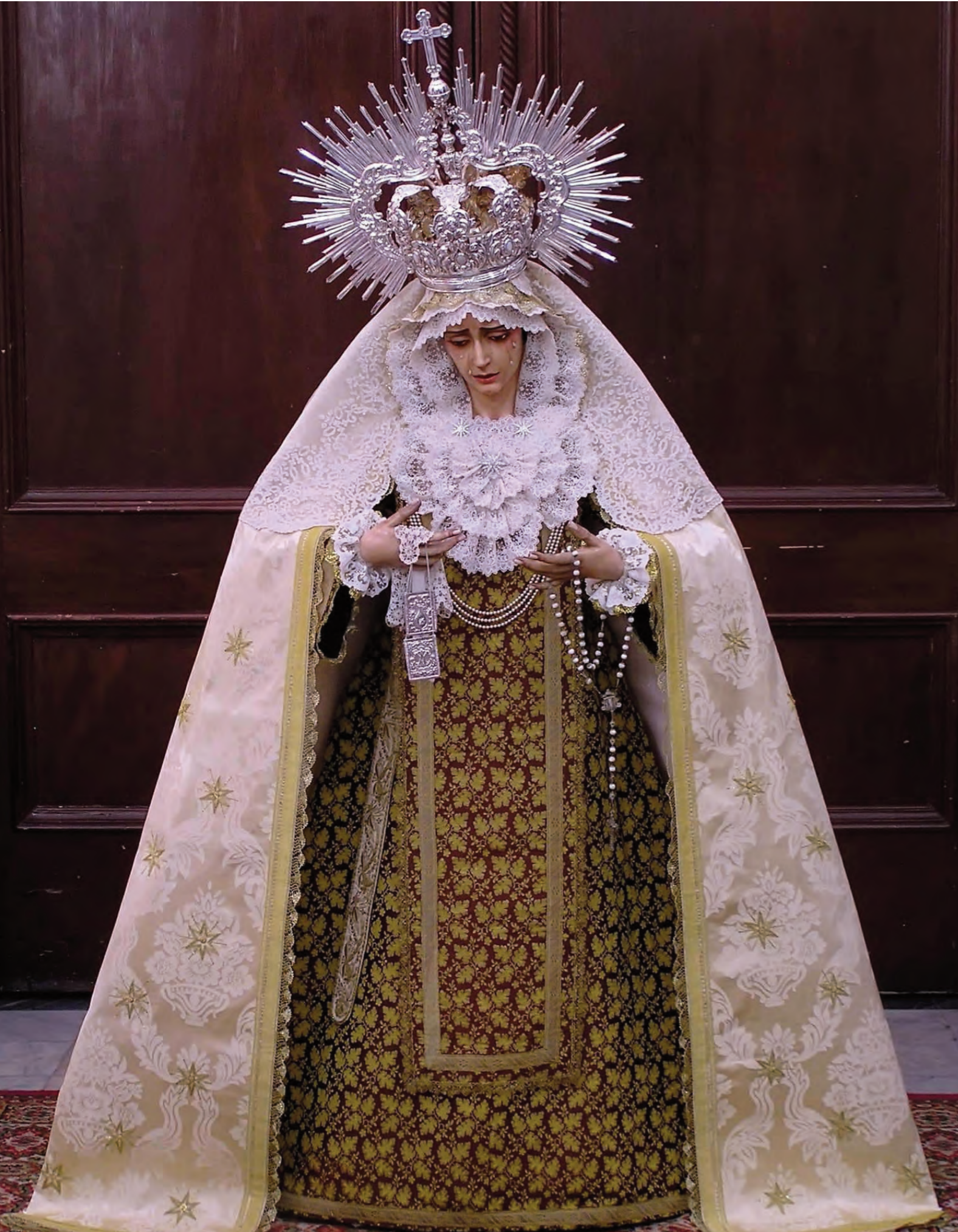
Nuestra Hermandad, haciendo gala y honor a su condición y profundo espíritu carmelitano, ha ataviado a la Santísima Virgen de la Piedad para este mes de julio con hábito, escapulario y capa, a la usanza carmelita, teniendo muy presentes las fechas del día 16 (Nuestra Señora del Carmen) y del 24, santo de la Hermana Cristina. Vestidor: Jesús Savona.