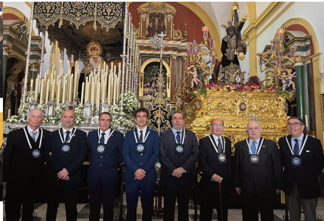
Fotografía histórica de los hermanos mayores que han presidido la Misericordia a lo largo de su historia.