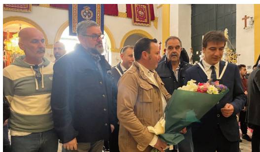
Asociación Jóvenes Cargadores Cofrades (JCC).