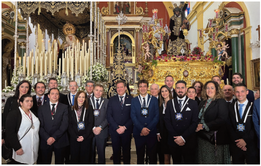
Hermandad de la Candelaria de Jerez.