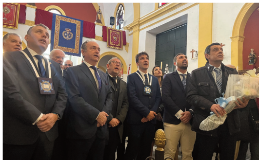
Hermandad de la Pastora.