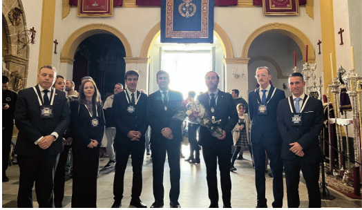
Hermandad del Santo Entierro.