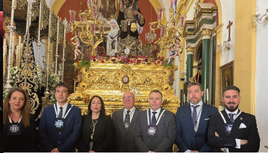
Hermandad de la Soledad.