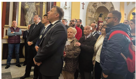
Hermandad del Huerto.