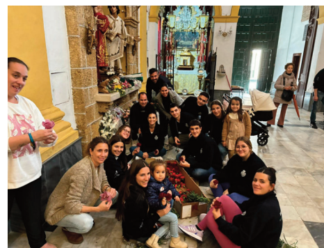
El futuro de la hermandad: los niños y los jóvenes de la Misericordia.