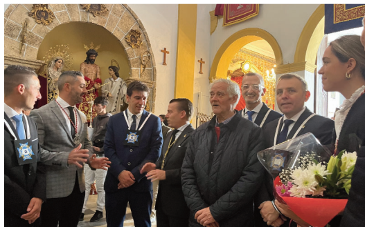
Hermandad del Ecce-Homo.