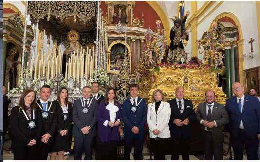
Visita institucional del Ayuntamiento y el Consejo de HH. y CC.