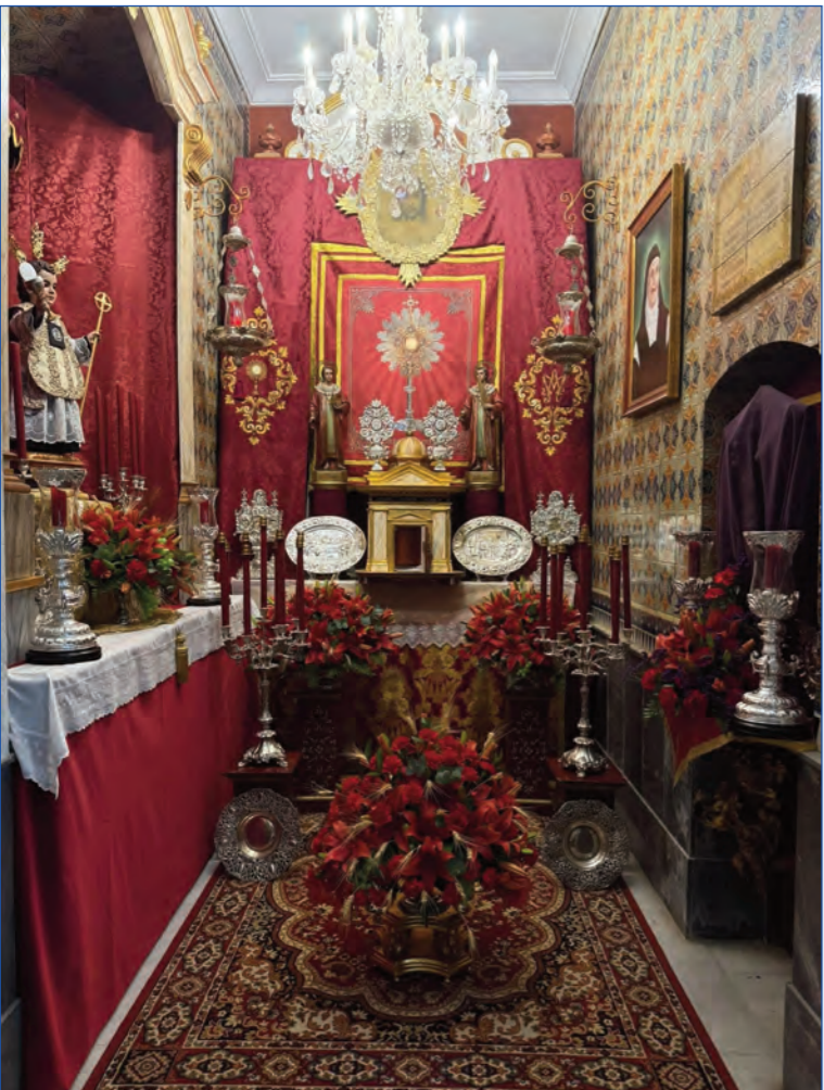
El Monumento, montado en nuestra capilla para la adoración de Su Divina Majestad durante el Jueves Santo.