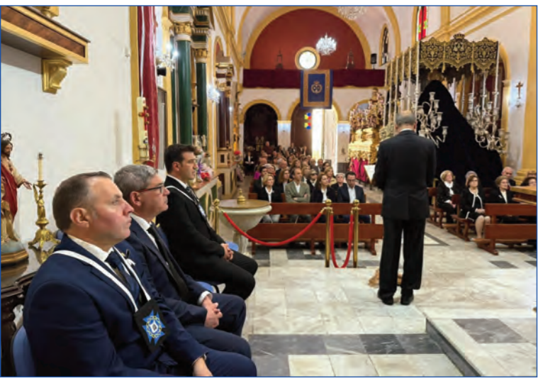
Celebración de los Santos Oficios el Viernes Santo en la parroquia de la Divina Pastora, con los pasos de nuestros Titulares en el templo.