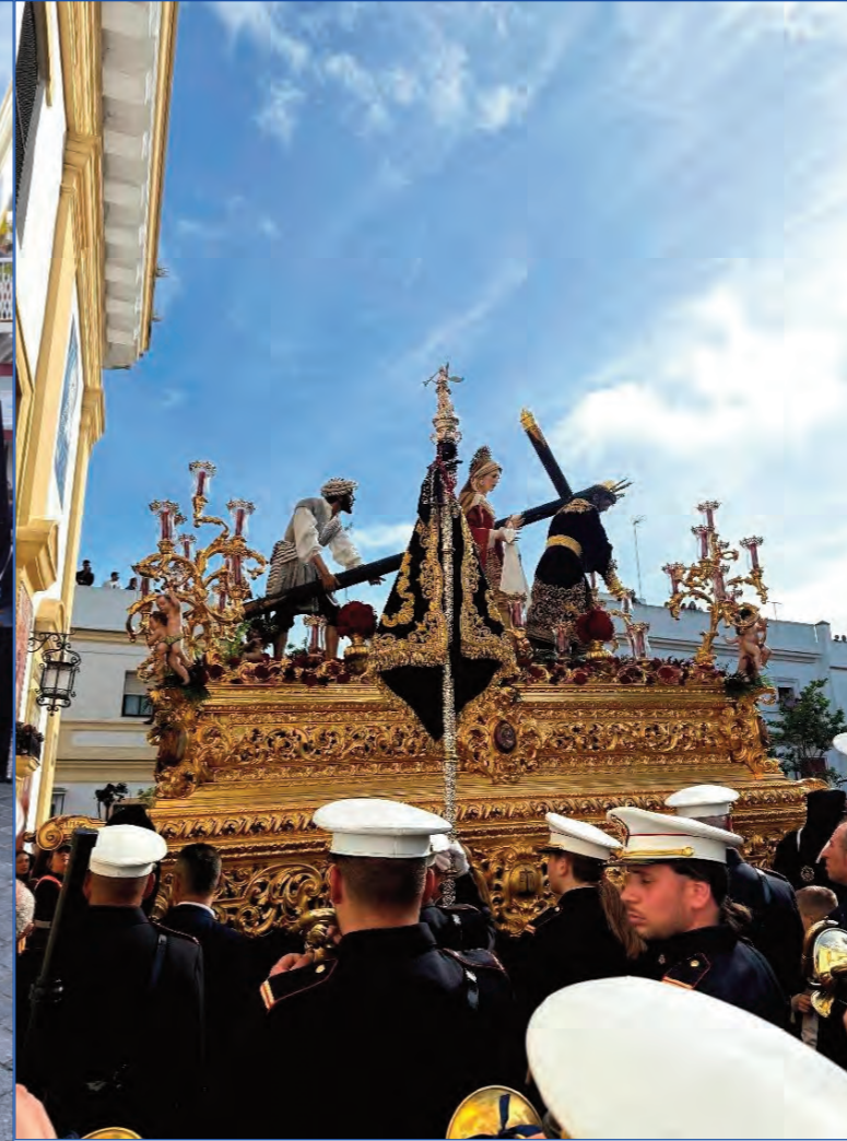
Salida del paso de misterio con la banda de cornetas y tambores Rosario y Victoria de Brenes. A la derecha, la nueva insignia carmelitana, en las secciones de la Virgen. En la imagen inferior se puede apreciar el manto bordado portado por Piedad de la Virgen del Rocío de Sevilla.