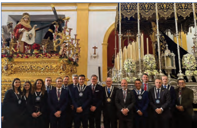
La Hermandad de la Candelaria de Jerez, con quien tenemos Carta de Hermandad, nos visitó el Jueves Santo como nuestra corporación hizo el Lunes Santo con la cofradía del barrio de la Plata.