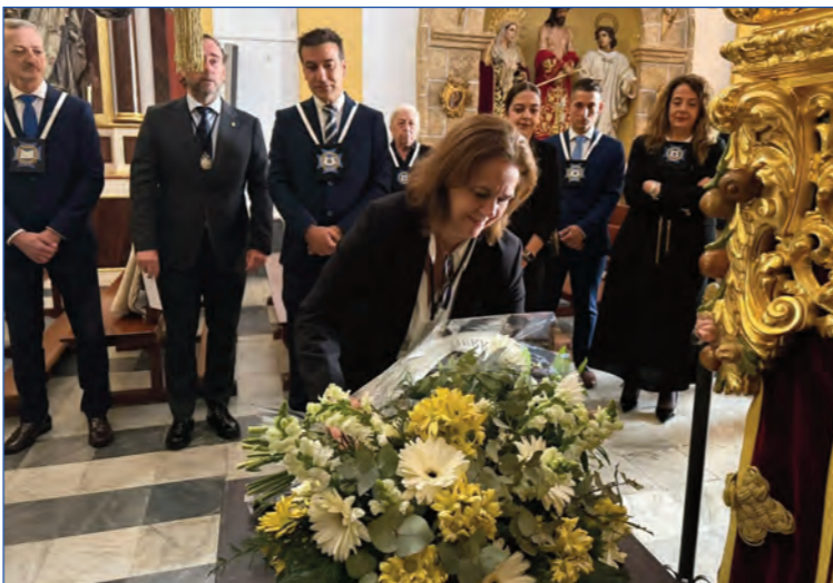
Ofrenda floral de nuestra hermandad hermana del Santo Entierro en la mañana del Jueves Santo.