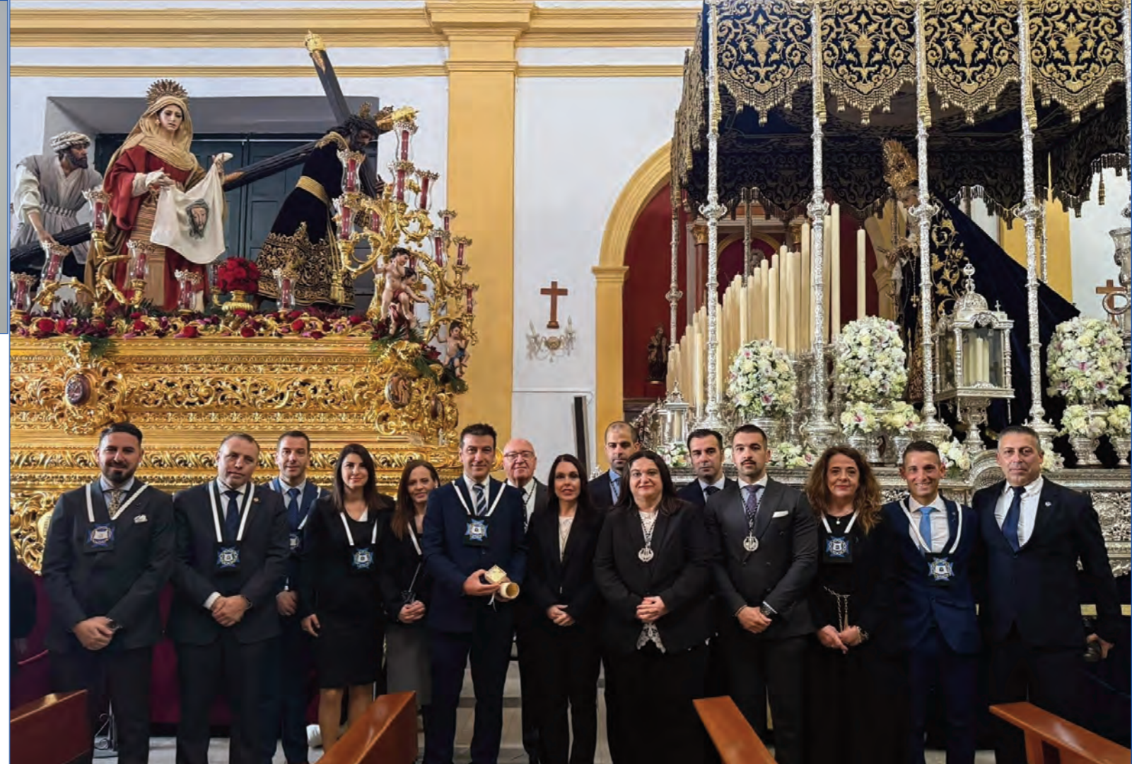
Las juntas de gobierno de las hermandades de la Soledad y Misericordia, en la mañana del Jueves Santo.