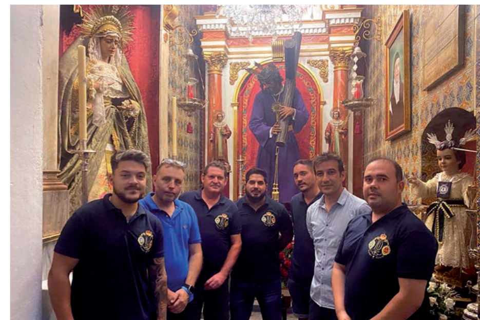
Los músicos de Rosario y Victoria de Sevilla visitaron a nuestros Titulares en agosto.