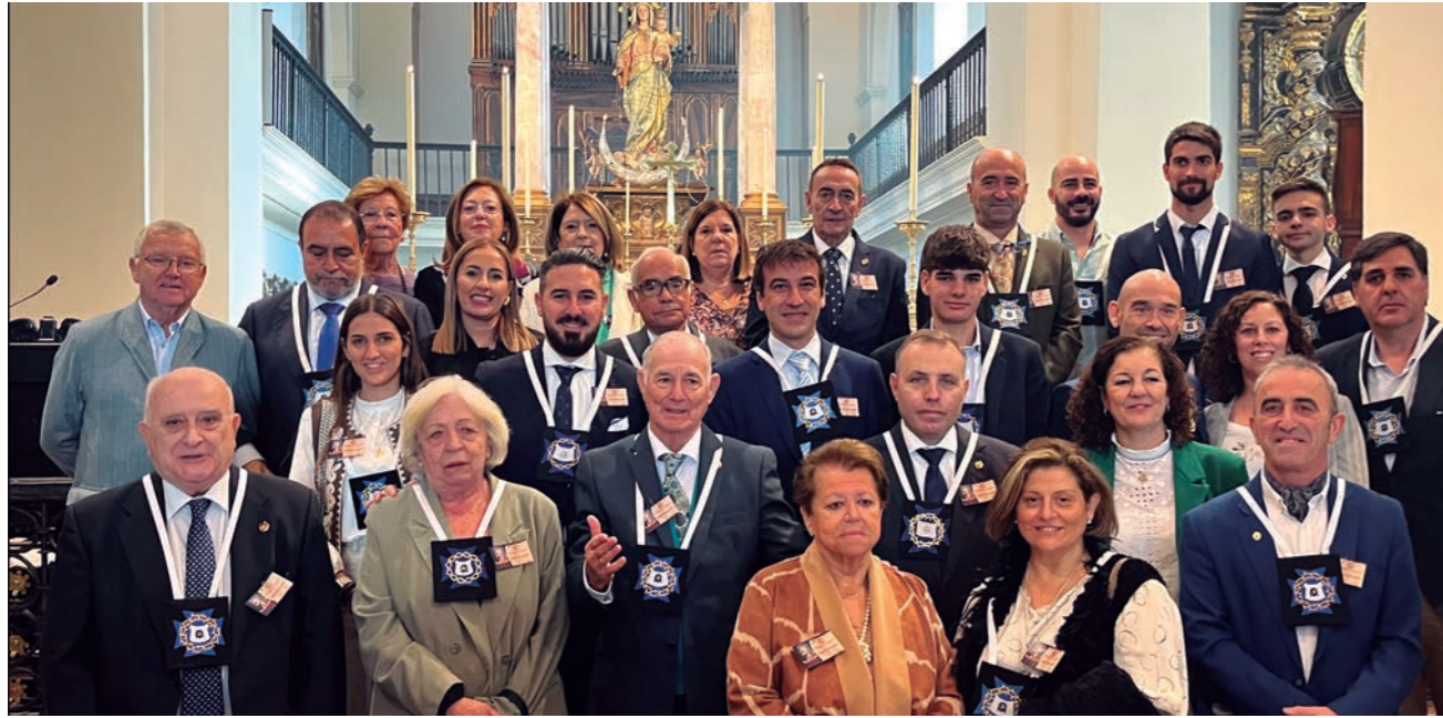
La comitiva formada por los hermanos y hermanas de la Misericordia de San Fernando en el XXXIV Encuentro.