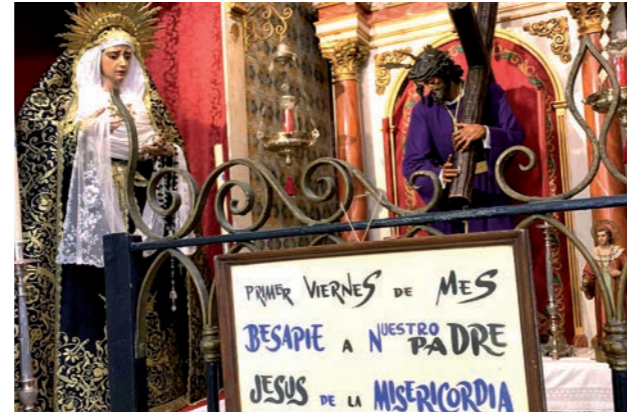
Nuestra hermandad celebra sus cultos mensuales cada primer viernes de mes. Te invitamos a participar en ellos.