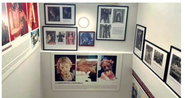
La casa de hermandad ha sido remozada en estos meses con un pintado y nuevos motivos y paneles en sus paredes.