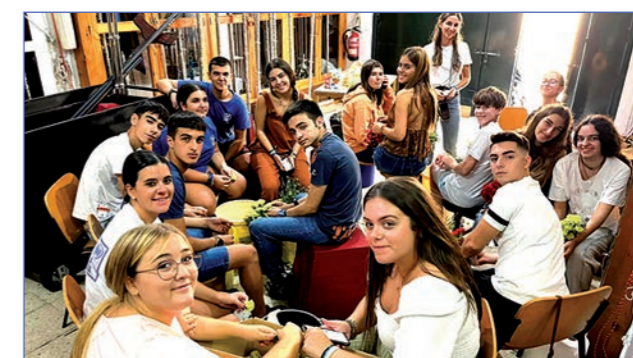
El Grupo Joven, preparando la petalada de la Magna Mariana.

Podemos estar tranquilos porque si continúan así, dejaremos a la hermandad en las mejores manos posibles.