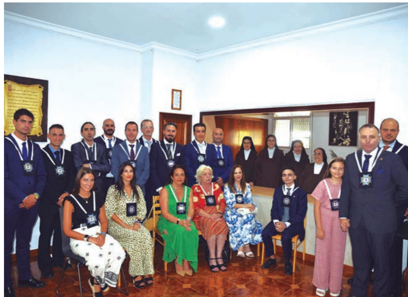
La nueva junta de gobierno de la hermandad con nuestras hermanas carmelitas.