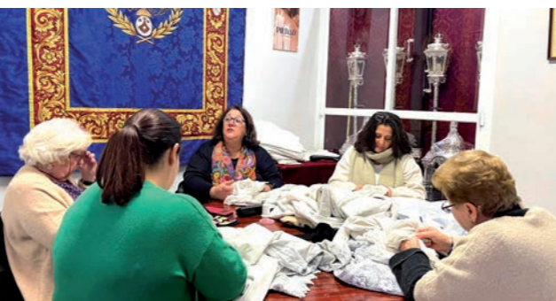
El grupo de costura «Virgen de la Piedad» en labores de mantenimiento y mejora de los ropajes del cortejo procesional.