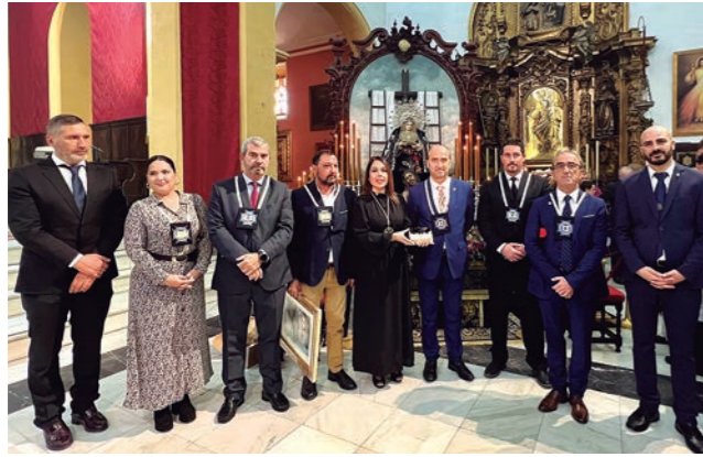
Homenaje a la Hermandad de la Soledad por su 275 aniversario. Entrega de un cuadro y un escapulario de orfebrería.