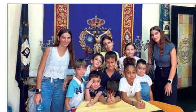
El recién creado Grupo Infantil.