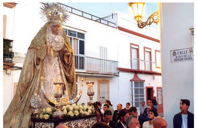
Rosario de antorchas con María Santísima de la Piedad. 13 de mayo de 2023.