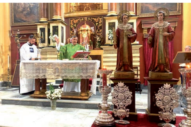
Eucaristía en honor de nuestros Titulares San Cosme y San Damián. 24 de septiembre de 2023.