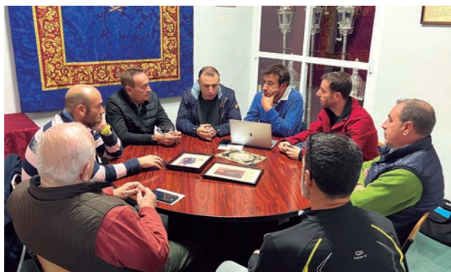
Nueva comisión de Relaciones Institucionales para relanzar vínculos como los existentes con la Casa Real y la Armada.