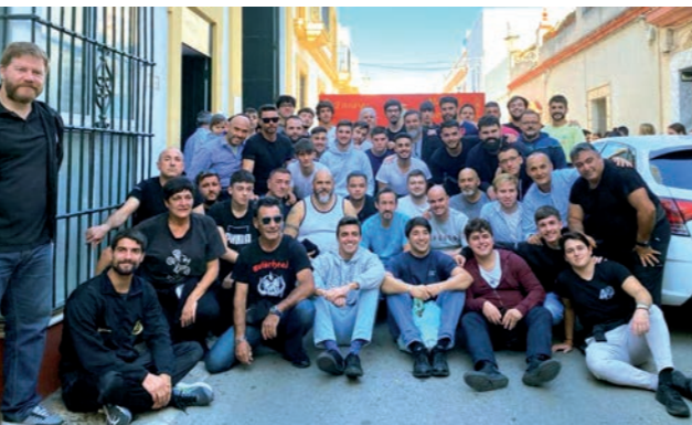
VI Ensayo Solidario «Manuel Moreno Cruceira» recogiendo víveres por el barrio con la JCC. 25 de noviembre de 2023.